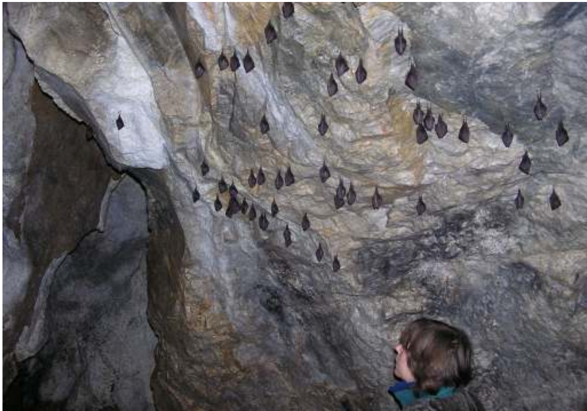
Auf dem Führungsweg. Für Fledermausschützer ein fast unglaubliches Bild, Kleinhufeisennasen über Kleinhufeisennasen!