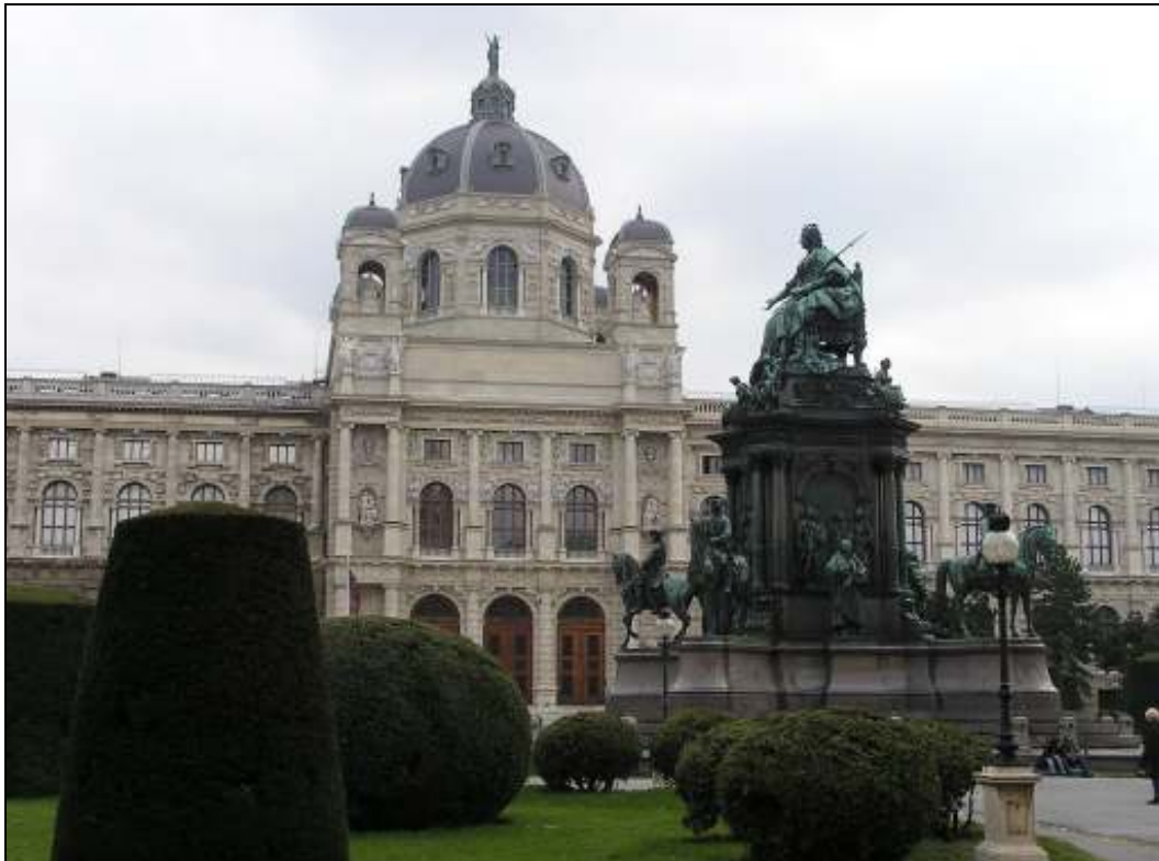
oben: Maria Theresia – Denkmal vor dem Naturhistorischen Museum, unten: Hofburg Wien