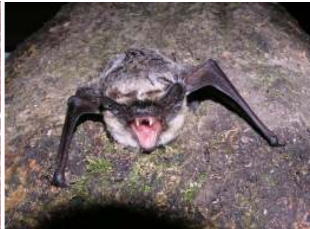
Zweifarbfliegermaus, nichts ist unmöglich?!

Schwerpunkt der Untersuchungen werden die Pinggen „Hartenberg-Marmorbruch“ und „Mittelberg“ sein. Es wird den Bartfledermäusen, der Nordfledermaus, der Mopsfledermaus und mit viel Glück der Zweifarbfledermaus nachgespürt. Die Fangplätze befinden sich in den Tagebauen und vor den Öffnungen von Abbauen des Altbergbaues. Die Kulisse der Fangplätze, die Felswände mit Moosen und Farnen, ist beeindruckend. Die Fangtermine sind so ausgerichtet, dass Reproduktionen nachgewiesen werden können.