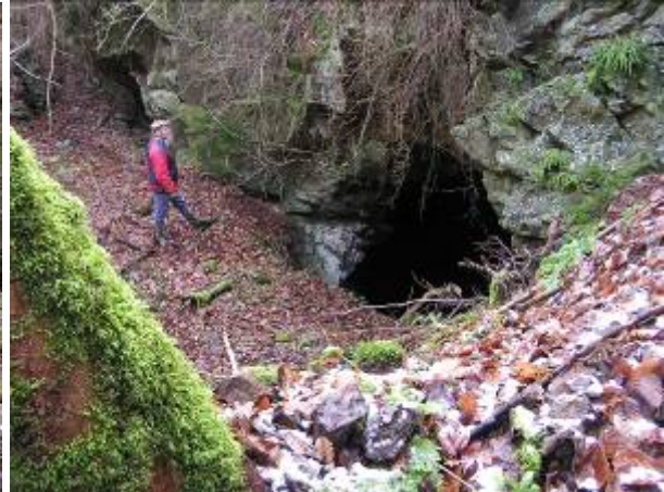
Pinge „Hartenberg-Marmorbruch“ (500 m ü. NN), Objekt für Wind geschützte Netzfangstandorte