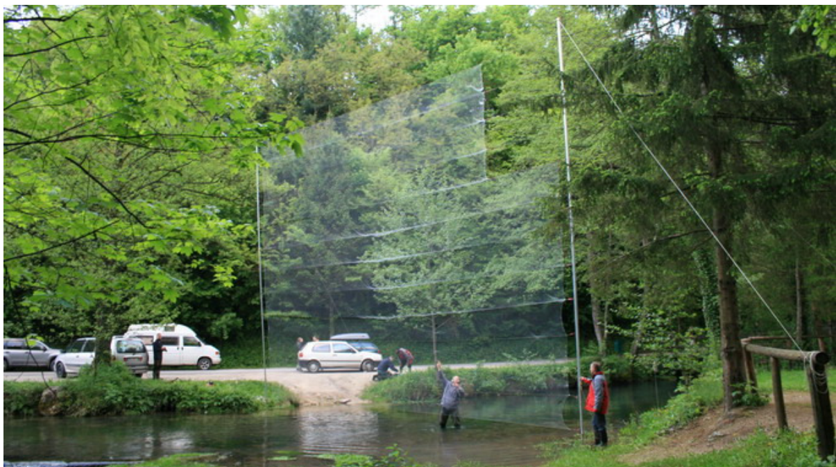
Busse-Hochnetz beim Einsatz in Slowenien

Arbeitskreis Fledermäuse Sachsen-Anhalt e.V.