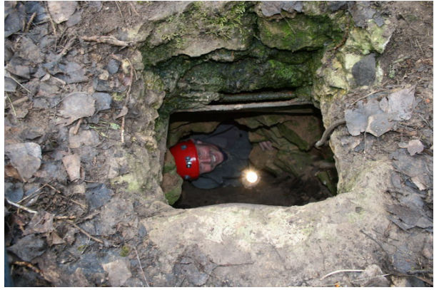
...es ist sehr eng...