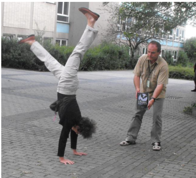
Prag im Fledermausfieber, Teilnehmer standen auf dem Kopf!

Nach 42 Jahren wurde nun wieder eine IBRC in Tschechien, in Prag, ausgerichtet. Eine Konferenz, welche für die über 500 Teilnehmer aus der Welt eine großartige und gelungene Veranstaltung war.