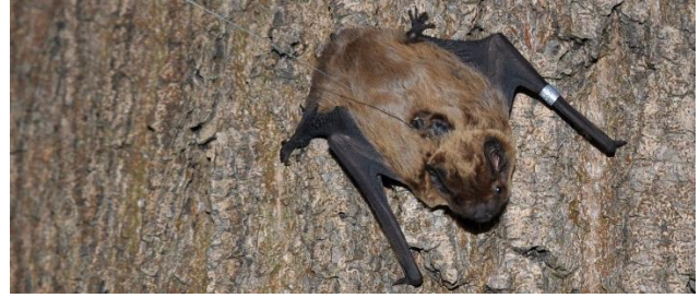
rechts: besenohrter Kleinabendsegler

Der Tag, die Uhrzeit der Besenderung sowie der Verlauf der Funkpeilungen mit Koordinaten, Tag und Uhrzeit werden für jedes Individuum täglich dargestellt.