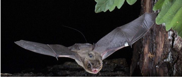
links: besenohrte Rauhautfledermaus