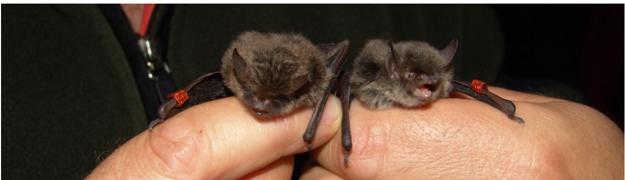
Rechts juveniles Weibchen und links adultes Männchen der Nymphenfledermaus