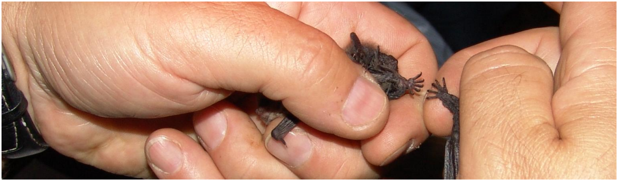
Links Fuß der Nymphenfledermaus und rechts der Großen Bartfledermaus

Auch in diesem Jahr konnte gut beobachtet werden, dass die Nymphenfledermaus als erste im Revier jagt. In den optimalen Reproduktionsgebieten der Nymphenfledermaus ist die Zwergfledermaus in den Jagdgebieten unterrepräsentiert.