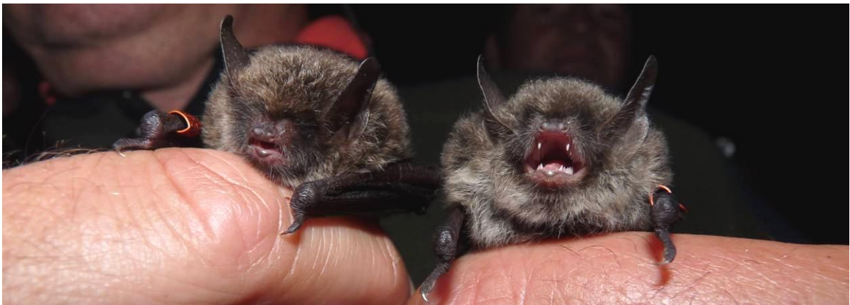
Rechts juveniles Weibchen und links adultes Männchen der Nymphenfledermaus

Im Vergleich zu anderen Nymphenfledermaus-Camps wurden in diesem Jahr weniger Individuen und weniger Fledermausarten gefangen. Nicht nur die ungünstige Witterung in der ersten Nacht, auch das sehr kühle und nasse Frühjahr und der lang anhaltende frühe und heiße Sommer 2010 dürften keine positiven „Spuren“ bei unseren Fledermäusen hinterlassen haben.