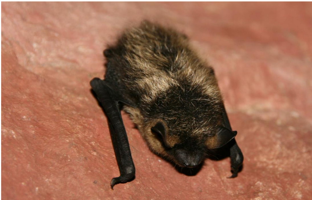
Nordfledermaus ( Eptesicus nilssonii )