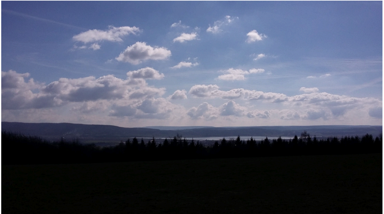
Stausee Kelbra