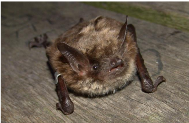
Teichfledermaus ( M. dasycneme )

Arbeitskreis Fledermäuse Sachsen-Anhalt e.V.