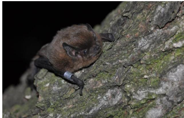
Rauhautfledermaus ( P. nathusii ) (K. KUHRING)