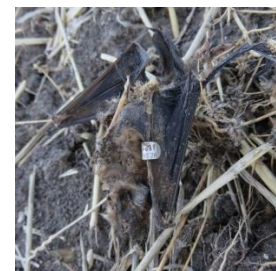
Toter beringter Abendsegler unter einer Windkraftanlage im Windpark Fischbeck (Sachsen-Anhalt).