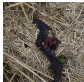
Tote Rauhauffledermaus unter einer Windkraftanlage im Windpark bei Laukžemė (Litauen).

Der herbstliche Zug bescherte allerdings auch schon die ersten Schlagopfer an Windkraftanlagen, wie auf den Fotos rechts ersichtlich. In einem Windpark in Litauen wurden beispielsweise bei einer einzigen sporadischen Begehung bereits 7 tote Rauhäute gefunden. In Sachsen-Anhalt wurde sogar ein beringter Abendsegler festgestellt.