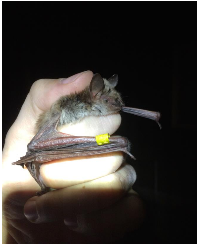
Myotis dasycneme M/ad