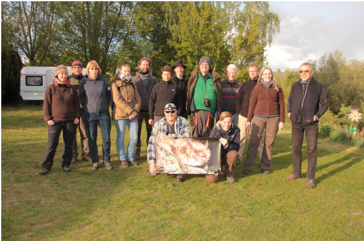
Bild 1. Teilnehmer des 11. Teichfledermauscamp 2019

Von einem Wonnemonat Mai konnte man 2019 nicht sprechen, er war zu kalt und nass. Das hielt zahlreiche Fledermausfreunde nicht davon ab, sich zum 11. Teichfledermauscamp in Schwedt/O im Seesportclub Schwedt/O e.V. einzufinden.