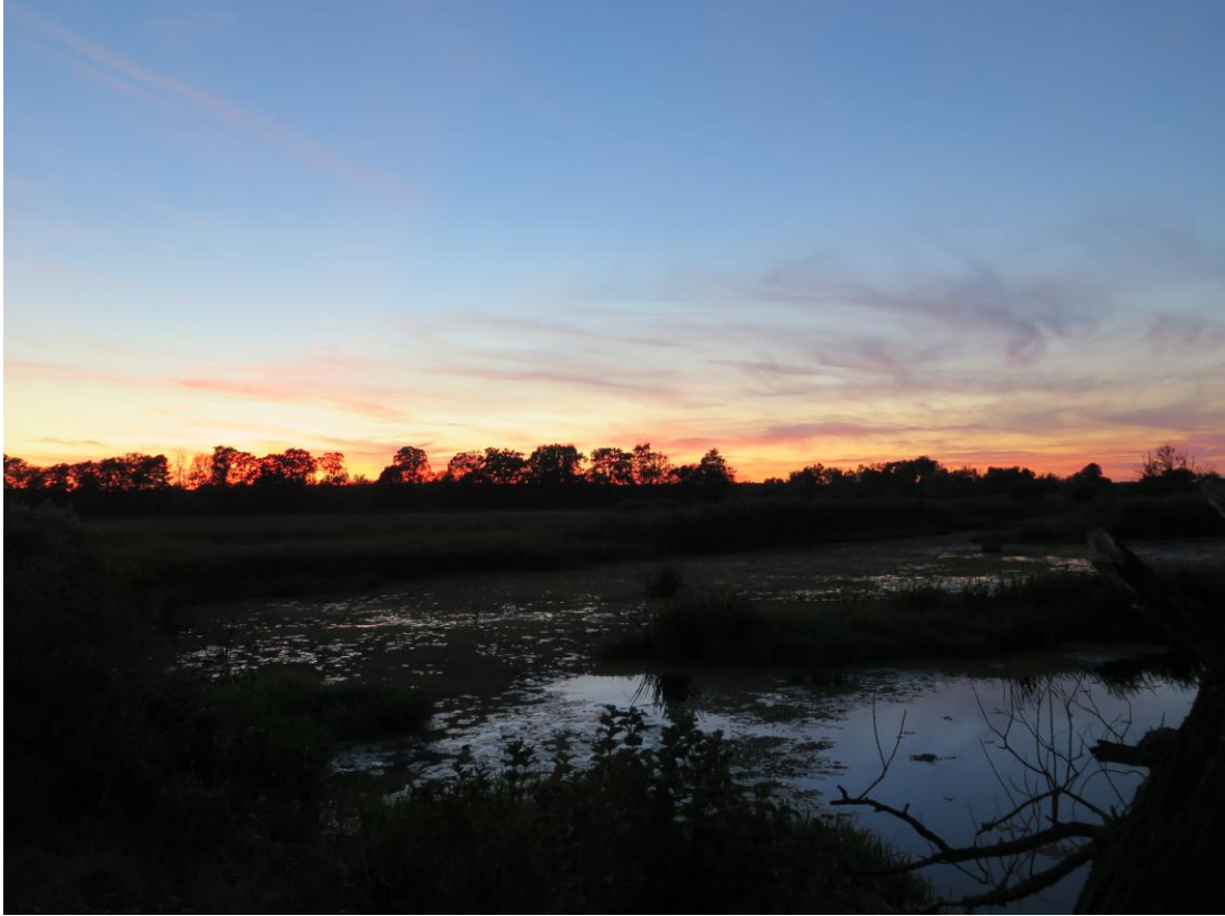
Impressionen Teichfledermauscamp 2019