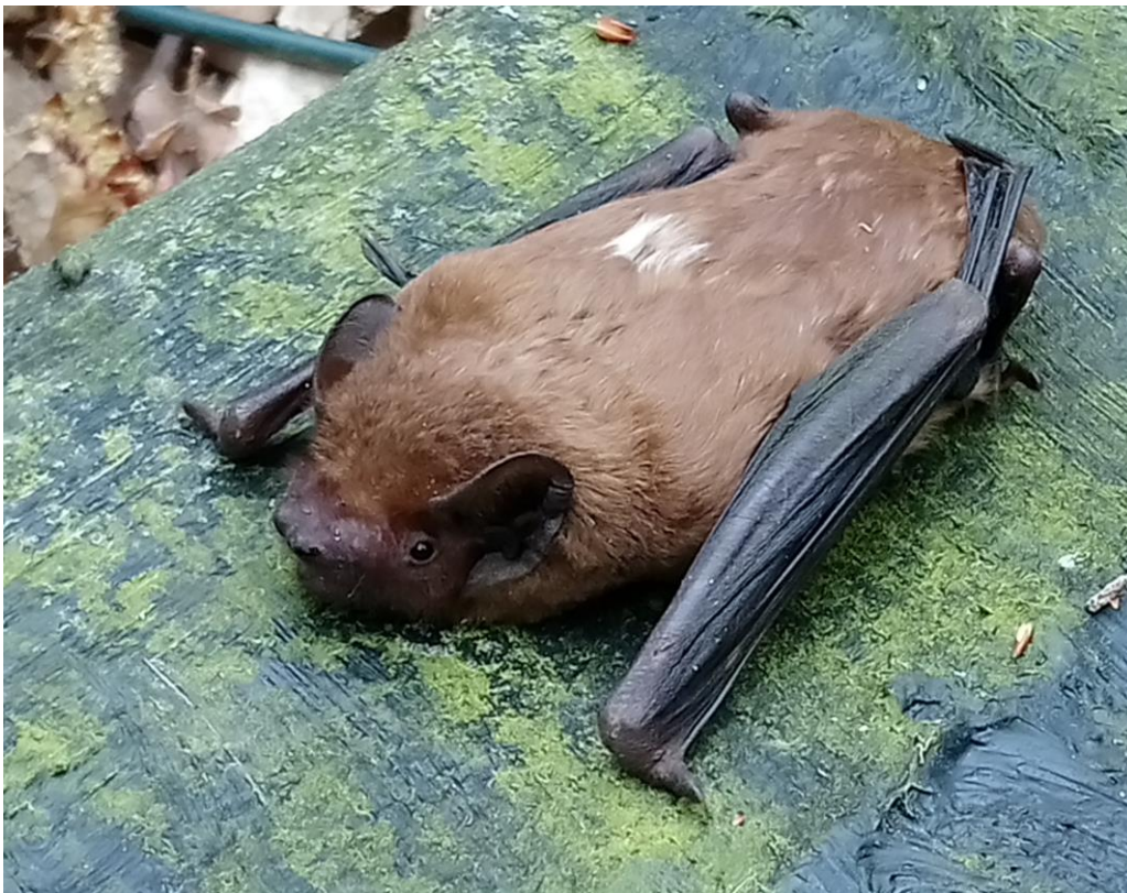
Bild 2. Großer Abendsegler ( N. noctula ) aus einem Fledermauskasten mit weißen Haarspitzen.

Ein besonderes Highlight war das heulen von zwei Wölfe am Netzfangstandort. Einer ging wenig später in eine Wildkamera des Forstleiters in unmittelbarer Nähe des Standortes.