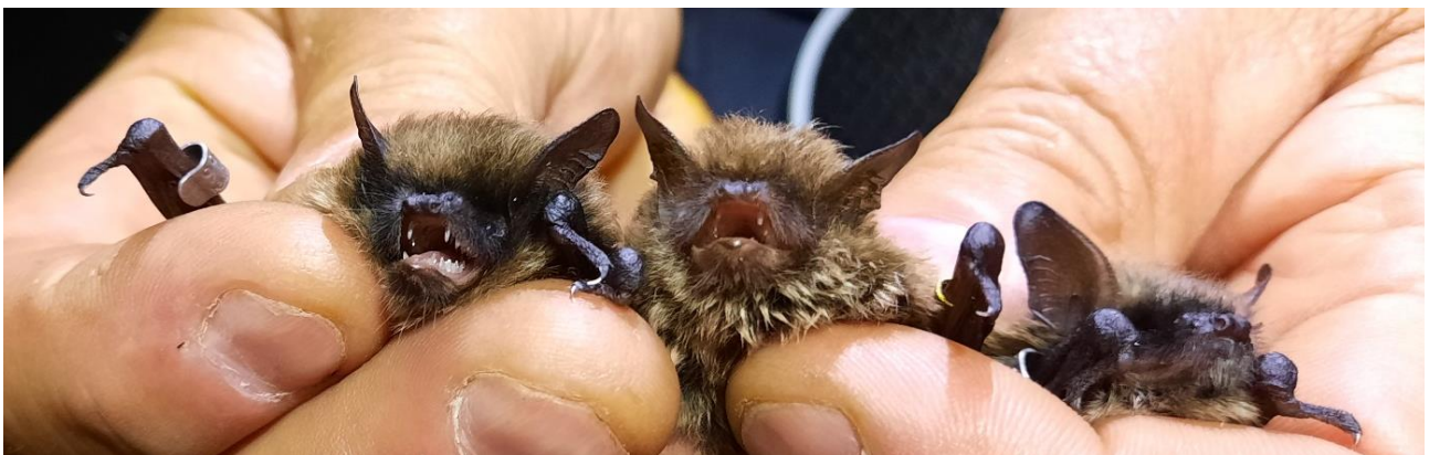
Die „Bartfledermaus-Arten“ - alles Alttiere - von links nach rechts: Kleine Bartfledermaus ( Myotis mystacinus ), Nymphenfledermaus ( M. alcathoe ) und Große Bartfledermaus ( M. brandtii ).

Bei diesem Camp wurden u. a. erstmals sehr viele Kleine Bartfledermäuse angetroffen, so dass reichlich Tiere für die Bestimmung und dem Erkennen von typischen Artmerkmalen zur Verfügung standen. Der direkte Vergleich unter diesen Arten war so gut möglich. Auch wie Jungtiere von Alttieren getrennt werden, bzw. wie sich die Pigmentierung von Haaren und Haut zwischen der Kleinen und Großen Bartfledermaus im Alter verändern, konnte studiert werden.