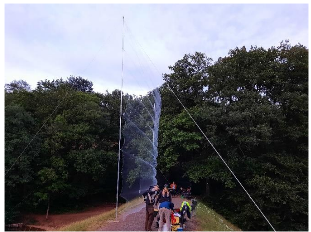
Aufbau eines 11 m hohen und 15 m breiten Peter Busse-Hochnetzes am Kunstteich.