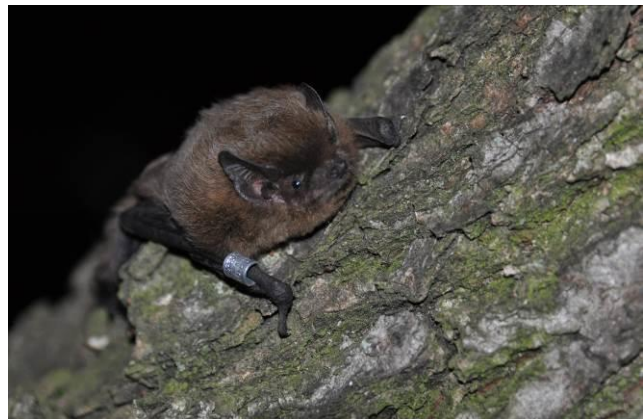
Rauhautfledermaus ( P. nathusii ) (K. KUHRING)